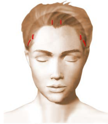
Incisions = cicatrices

Le jour de l'intervention, au moindre doute, un test nicotinique urinaire pourrait vous être demandé et en cas de positivité, l'intervention pourrait être annulée par le chirurgien.